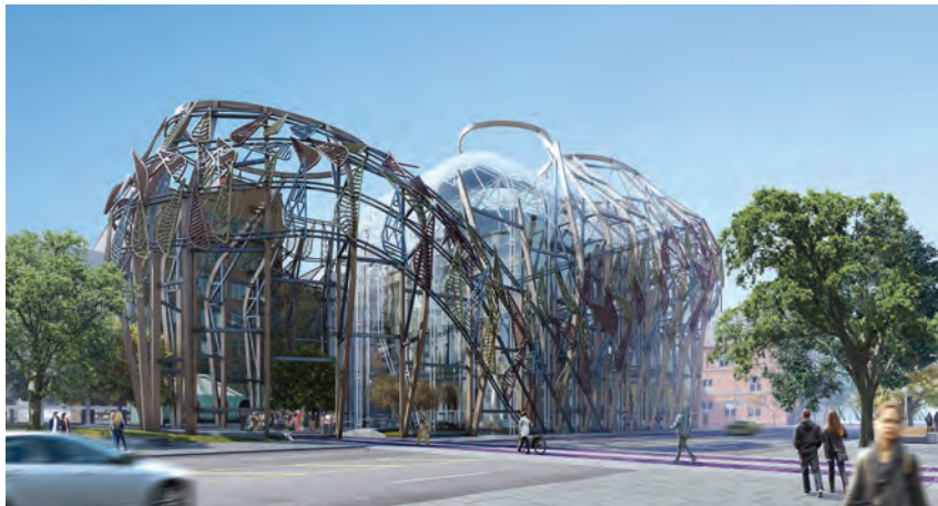
Tawaw Architecture Collective