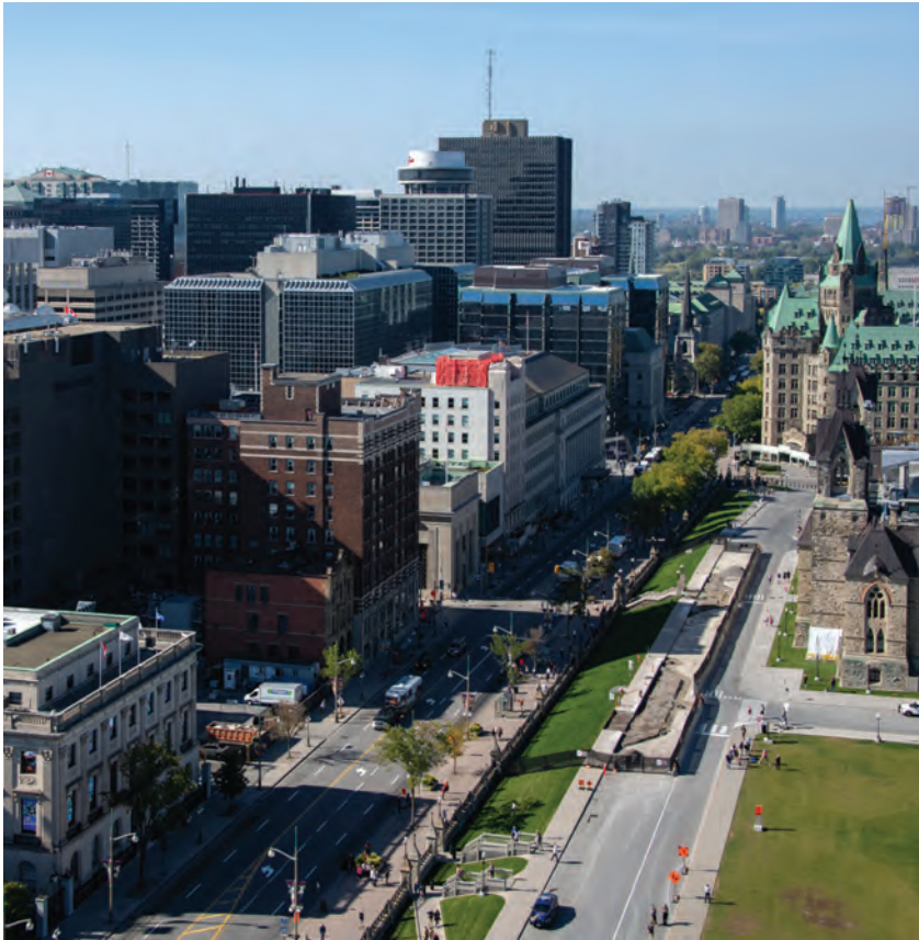
PSPC 2019-20 Annual Report

The city block sits at the junction of “town and crown,” fronting the commercial Sparks Street on its south side, and the ceremonial Wellington Street and Parliament Hill on its north side.