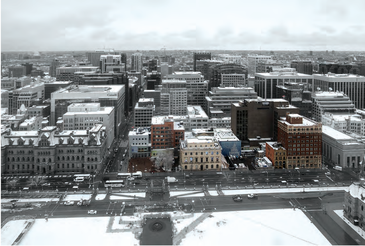
PSPC 2019-20 Annual Report

At the centre of Block 2, the new Indigenous Peoples Space will be located on the sites of the former American Embassy and the CIBC Banking Hall.