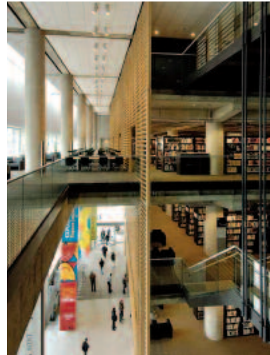
La Grande Bibliothèque du Québec – concours de 2000 | architectes : Patkau / Croft-Pelletier / Menkes Shoener Dagenais Associated Architects

L'IRAC présente deux nouveaux titres de la série Bâtitteur d'entreprise : Bâtir sa collaboration avec les médias et Modélisation des données du bâtiment (BIM) . Les membres de l'IRAC peuvent télécharger gratuitement ces deux documents.