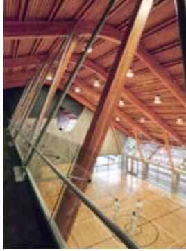
Centre communautaire de Gleneagles

Patkau Architects (Vancouver, C.-B.) Architectes concepteurs : John Patkau, FRAIC et Patricia Patkau, FRAIC