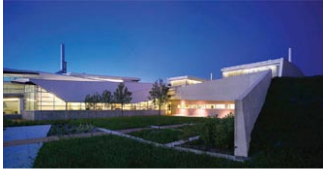
Trent University Chemical Sciences Building