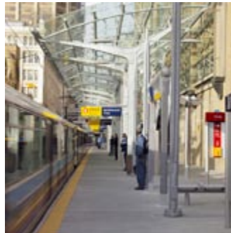
Réaménagement de la station du TLR de la 7 e avenue