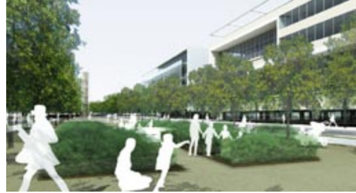
Le Campus Outremont

Le Campus Outremont (Montréal, Qc) Principaux responsables : Groupe Cardinal Hardy en collaboration avec Provencher Roy + Associés architectes