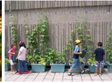
Création du Jardin du Roulant