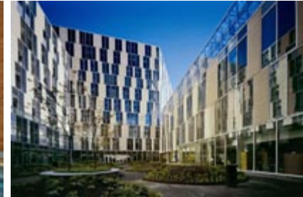
Complexe des sciences Pierre-Dansereau, Université du Québec à Montréal