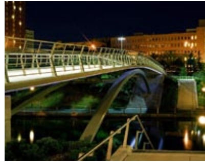
Passerelle Corktown

Principaux responsables : Goldsmith Borgal & Company Limited; Kuwabara Payne McKenna Blumberg Architect, Goldsmith Borgal & Company Limited, architectes en consortium; architectsAlliance; Urban Strategies