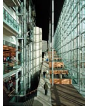
Ajout à la Bibliothèque du centenaire de Winnipeg