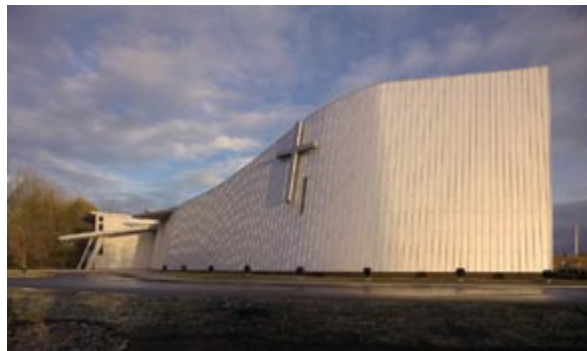
Scarborough Chinese Baptist Church

Lang Wilson Practice in Architecture Culture Inc. (architecte concepteur) et Hotson Bakker Boniface Haden Architects, Associated Architect (Vancouver, C.-B.) Architecte concepteur : Oliver Lang, MRAIC