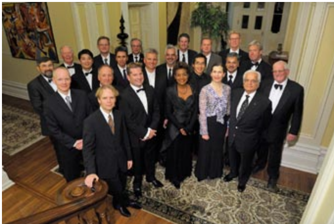
Son Excellence et les récipiendaires des Médailles du Gouverneur général en architecture de 2008 | Photographe : Cplc Jean-François Néron, Rideau Hall

l'IRAC, contribue au rayonnement de la discipline et sensibilise le grand public à la force culturelle vive que représente l'architecture dans la société canadienne. L'IRAC administre ces prix de concert avec le Conseil des Arts du Canada, qui assume la responsabilité du processus d'attribution et contribue à la publication des lauréats.