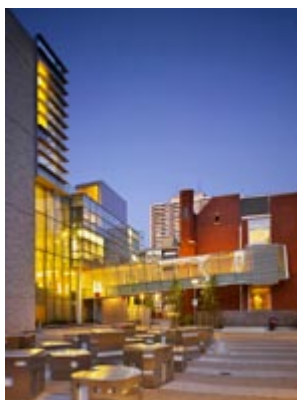
Projet Grand Jeté de l'École nationale de ballet du Canada

Projet Grand Jeté de l'École nationale de ballet du Canada Kuwabara Payne McKenna Blumberg Architects & Goldsmith Borgal & Company Ltd. Architects, architectes en consortium (Toronto, Ont.) Architectes concepteurs : Bruce Kuwabara, FRAIC et Phil Goldsmith, MRAIC