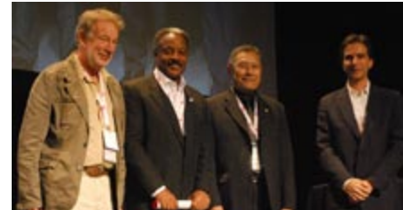
Ian Athfield, FNZIA, FRAIA, Marshall E. Purnell, Hon. MRAIC, Kiyoshi Matsuzaki, PP/FRAIC, Alec Tzannes, Hon. MRAIC

Kiyoshi Matsuzaki PP/FRAIC s'est rendu en Australie afin d'accepter l'invitation provenant du président de l'Australian Institute, Howard Tanner, Hon. MRAIC à participer au congrès national de l'Australian Institute of Architects.