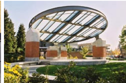
Leigh Square | photo : Boldwing Continuum Architects Inc.