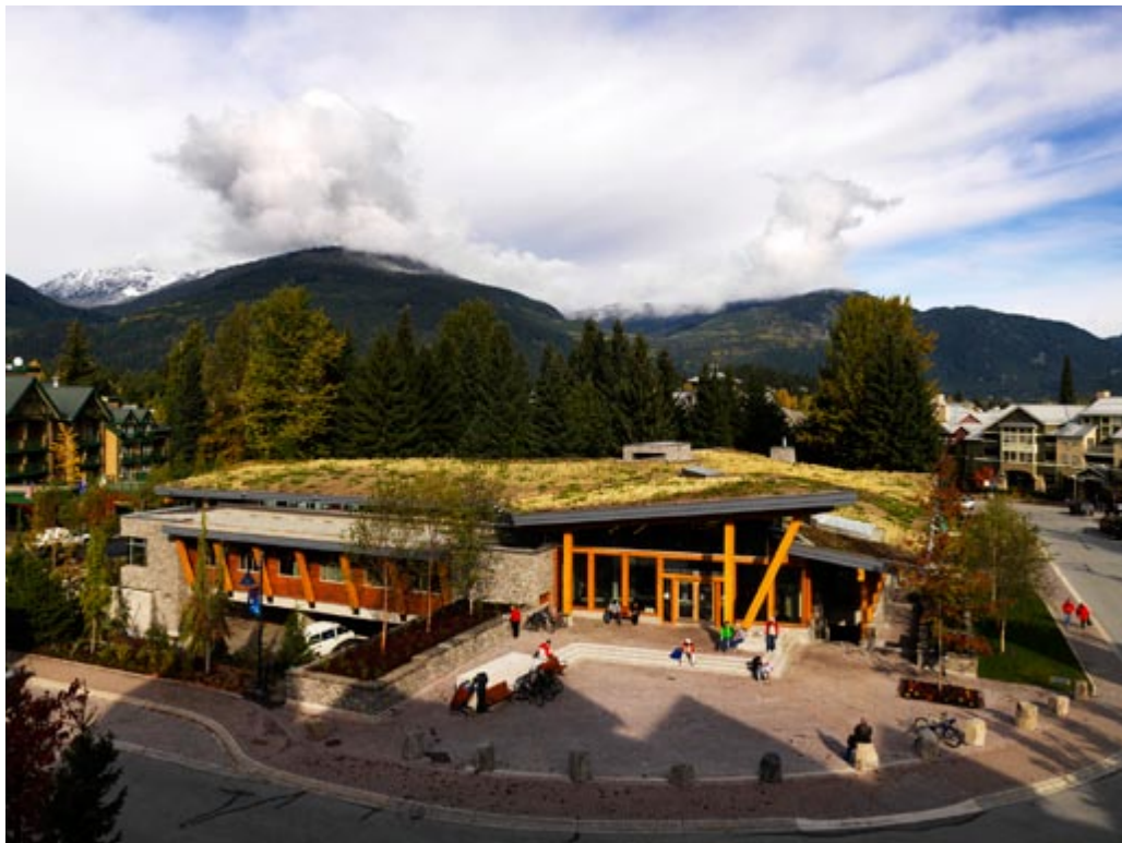
Whistler Public Library | Hughes Condon Marler: Architects