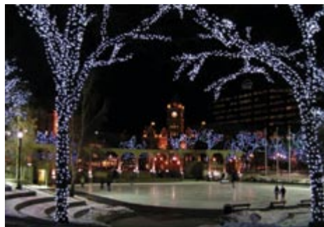
Calgary Starts Here: Stratégie d'amélioration de l'Olympic Plaza Cultural District