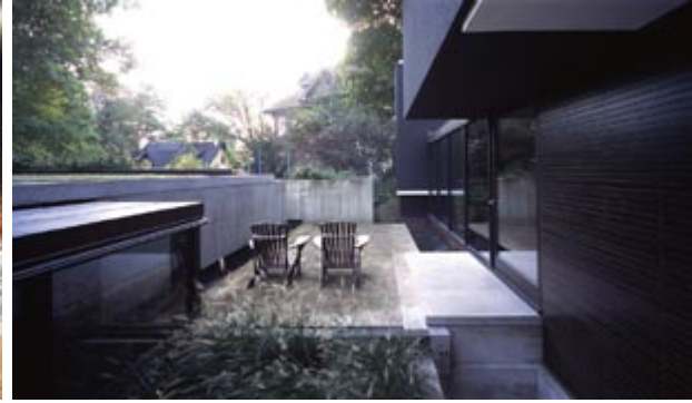
Maison du 4a Wychwood Park