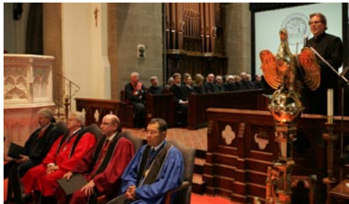
Cérémonie d'intronisation des nouveaux fellows de 2008

Le chancelier et le comité national du Collège des fellows administrent les activités du Collège des fellows et agissent comme administrateurs de la Fondation de l'IRAC.