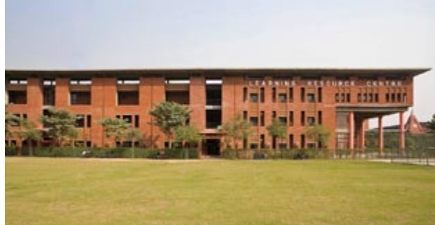
L'Institut de technologie de l'information de Jaypee

Le Groupe Arcop (Montréal, Qc) Architecte concepteur : Ramesh Khosla, FRAIC