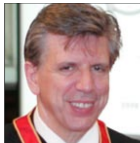
L'honorable Herménégilde Chiasson, Hon. FIRAC