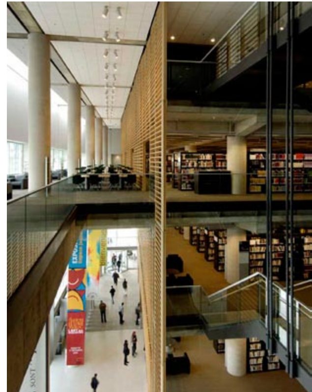
La Grande Bibliothèque du Québec (concours de 2000) | Patkau / Croft Pelletier / Menkes Shoener Dagenais Associated Architects

Toute l'information contenue dans le site Web a été révisée et elle fait l'objet de mises à jour régulières pour en assurer la qualité et la pertinence.