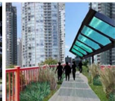
False Creek