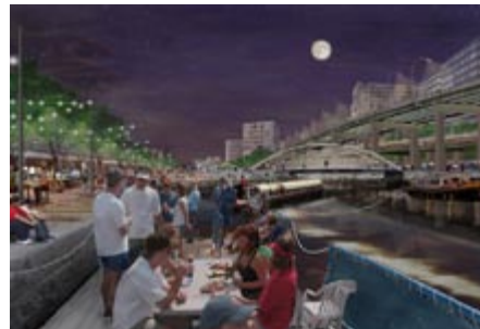
Lower Don Lands

Passerelle Corktown (Ottawa, Ont.) Principal responsable : Du Toit Allsopp Hillier / Du Toit Architects Limited