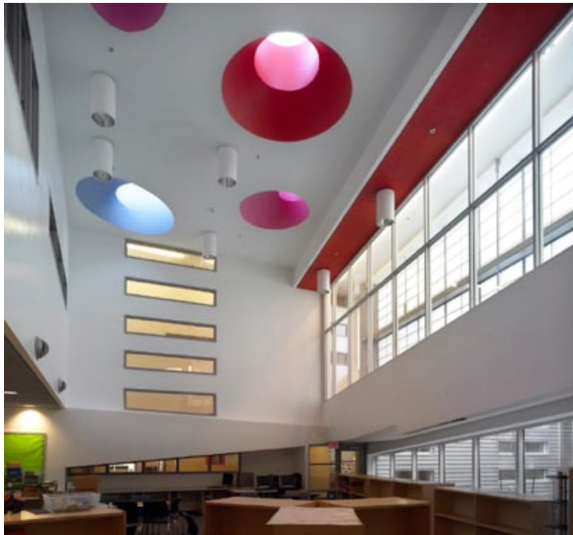
Brookside Public School (certifié LEED® Or) | Teeple Architects Inc.