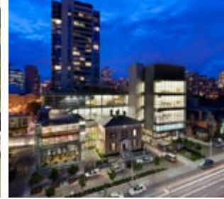
L'École nationale de ballet du Canada / Projet Grand Jeté : Phase 1 Campus de la rue Jarvis et Radio City | photo : Tom Arban