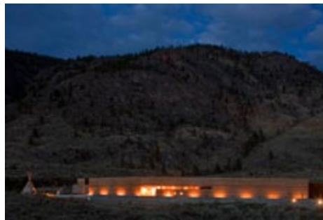
Centre culturel sur le désert de Nk'Mip | photo : Nic Lehoux

Moriyama & Teshima Architects (Toronto, Ont.) / Griffiths Rankin Cook Architects (Ottawa, Ont.) : en consortium Architectes concepteurs : Raymond Moriyama, FRAIC et Alexander Rankin, FRAIC