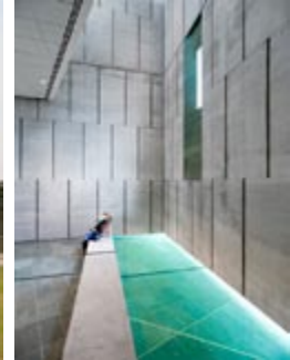
Nouveau Musée canadien de la guerre