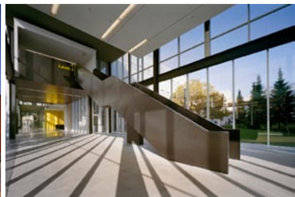
Communication, Culture and Technology Building – University of Toronto Mississauga

Communication, Culture and Technology Building – University of Toronto Mississauga Saucier + Perrotte architectes (Montréal, Qc) Architecte concepteur : Gilles Saucier, FIRAC