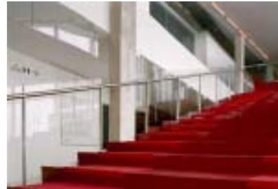
Théâtre du Vieux-Terrebonne

Théâtre du Vieux-Terrebonne atelier TAG et Jodoin Lamarre Pratte et Associés Architectes en consortium (Montréal, QC) Architectes concepteurs : Manon Asselin, Katsuhiko Yamazaki (atelier TAG)