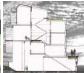
Urban Garden Live + Work