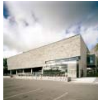
Bibliothèque Municipale de Châteauguay