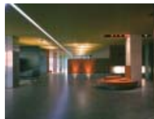
Institut de tourisme et d'hôtellerie du Québec