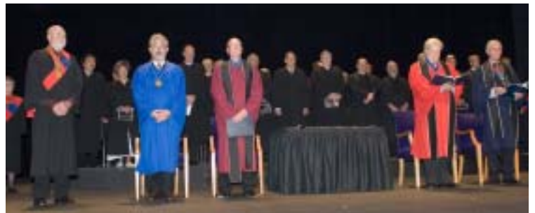
Cérémonie d'intronisation des nouveaux fellows de 2006

Le chancelier et le comité national du Collège des fellows administrent les affaires du Collège des fellows et agissent comme fiduciaires de la Fondation de l'IRAC.