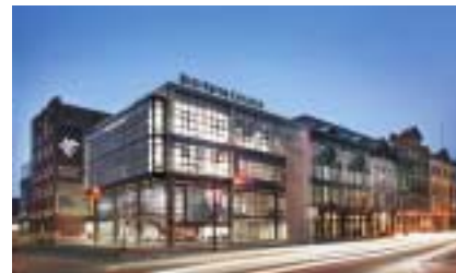
Red River College, Princess Street Campus