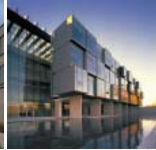
L'Institut Perimeter

Architecte concepteur : Siamak Hariri, MRAIC