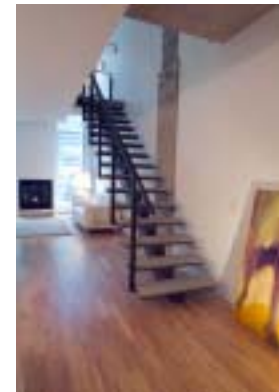
Unity 2

Unity 2 Cormier, Cohen, Davies architectes (Atelier Big City) (Montréal, Québec)