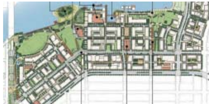
Southeast False Creek Public Realm Plan

Sturgess Architecture, en association avec Carlyle and Associates et Keith Orlesky