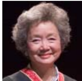
La très honorable Adrienne Clarkson, Hon. FRAIC