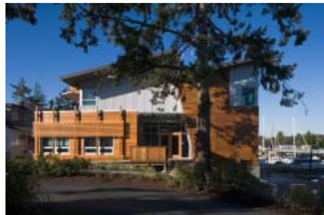
Centre des opérations de la Réserve de parc national du Canada des Iles-Gulf (LEED Canada Platine) | Larry McFarland Architects Ltd.

D'ici 2012, les architectes vont concevoir 100 000 projets de construction et de rénovation aux quatre coins du pays. Ces bâtiments consommeront 50 pour cent moins d'énergie que ceux d'aujourd'hui, tout en constituant des endroits sains et agréables à vivre. Actuellement, il y a des projets d'une valeur de 30 à 40 milliards de dollars sur les tables à dessin des architectes canadiens. Une fois construits, leur empreinte carbonique sera en place pour 100 ans. Nous pouvons tous faire mieux. Si chacun des bâtiments que nous concevons ou rénovons réduit les gaz à effet de serre d'aussi peu que 50 pour cent, ce sera déjà une très grosse différence.