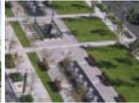
Quartier international de Montréal