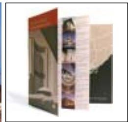
TSA Guide Map