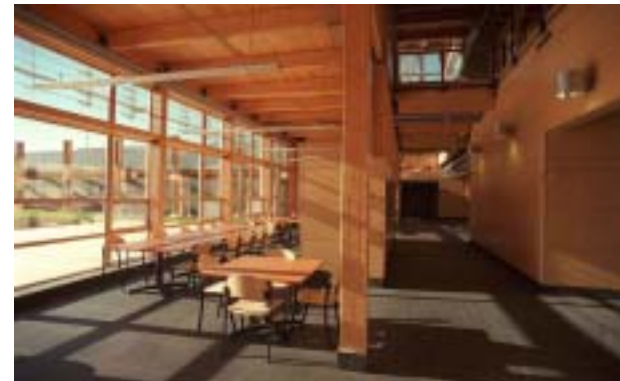
Pavillon Gene-H.-Kruger | architectes : André Moisan et Paul Gauthier, FIRAC

Nous avons publié deux numéros de notre magazine promotionnel, Architecture, un magazine à l'intention des donneurs d'ouvrage publics et institutionnels . Ce magazine est transmis aux représentants du secteur MESSS – municipalités, organismes municipaux, conseils et commissions scolaires, entités d'enseignement supérieur, services de santé ou services sociaux financés par l'État. Le numéro printemps/été a porté sur les universités et les collèges et a été transmis aux administrateurs des universités et des collèges. Le numéro suivant portait sur les hôpitaux et les établissements de soins de longue durée et a été transmis à tous les présidents et chefs de la direction des hôpitaux et des établissements de soins de longue durée. Les membres de l'IRAC en ont également reçu un exemplaire pour qu'ils soient au courant des démarches de l'IRAC en leur nom.