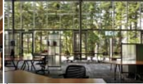
Édifice à bureaux de SC3-Smith Carter

Édifice à bureaux de SC3-Smith Carter Smith Carter Architects and Engineers Incorporated (Winnipeg, Manitoba)