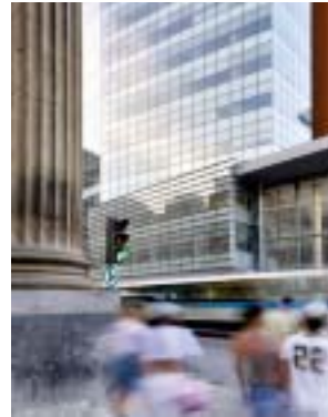
Le Quartier Concordia Phase 1 | photo : Tom Arban