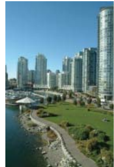
Marinaside Crescent