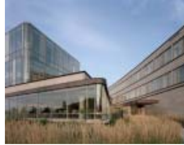
Schulich School of Business

Schulich School of Business, Université York Hariri Pontarini Architects, Robbie/Young + Wright Architects en consortium (Toronto, Ontario)