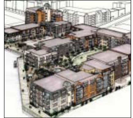
Ensemble Bishop's Landing | Lydon Lynch Architects Ltd

L'IRAC a soumis un mémoire sur le budget fédéral, le financement des infrastructures et le déséquilibre fiscal au ministre des Transports, de l'Infrastructure et des Collectivités, Lawrence Cannon, et a plus tard présenté ce mémoire au ministre dans le cadre d'une rencontre de consultation. L'IRAC a insisté sur l'importance de s'assurer que tous les projets subventionnés par le gouvernement fédéral soient durables, qu'ils illustrent une architecture de qualité et qu'ils constituent un apport positif au design urbain.