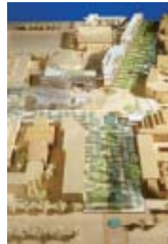
UBC University Boulevard