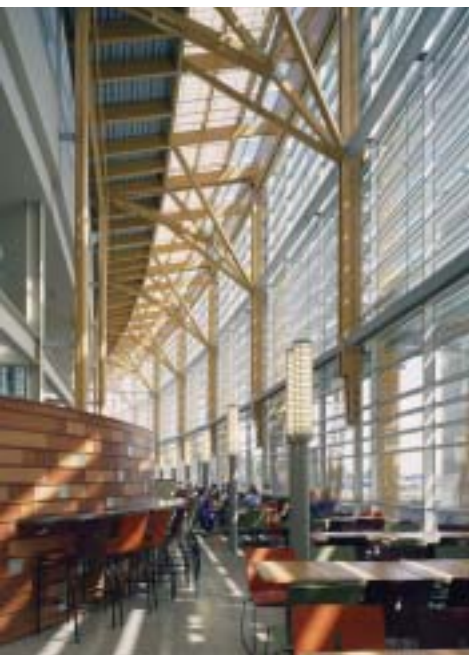
Centre régional des sciences de la santé de Thunder Bay | Salter Farrow Pilon Architects Inc.

Les architectes savent que les bâtiments peuvent être beaucoup plus éconergétiques qu'ils ne le sont aujourd'hui, et ce, à un coût supplémentaire minime ou nul. L'implantation adéquate du bâtiment, sa forme, les propriétés du verre et l'emplacement des fenêtres, le choix des matériaux et l'intégration de stratégies favorisant le chauffage, le refroidissement et la ventilation naturels et prévoyant la pénétration de la lumière du jour sont des mesures qui permettent d'y parvenir.