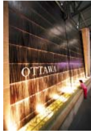
Ouvrage d'eau de l'aéroport d'Ottawa