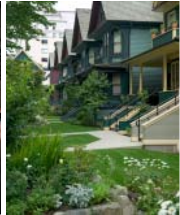
Projet résidentiel de Mole Hill