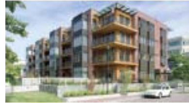
The South Circle Building

Projets d'améliorations communautaires – TSA Guide Map: Toronto Architecture 1953-2003 Toronto Society of Architects Map Committee