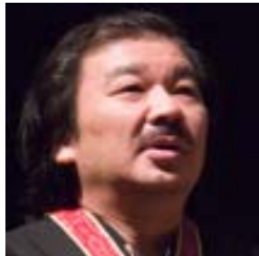
Shigeru Ban, Hon. FRAIC