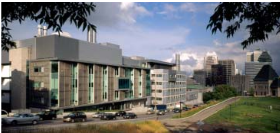
Université McGill et Centre d'innovation Génome Québec | Kuwabara Payne McKenna Blumberg Architects, Fichten Soiferman et Associés, Architectes, architectes en consortium