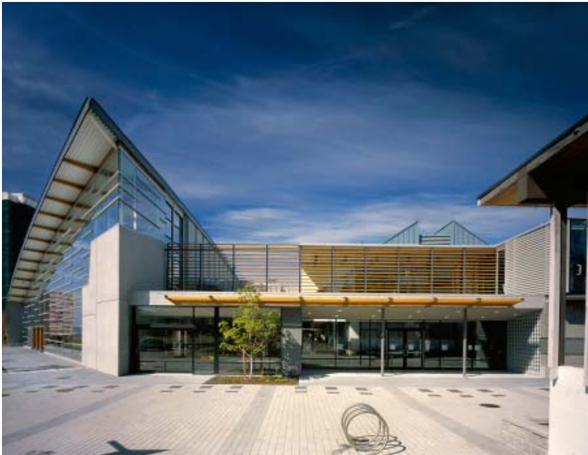
Centre aquatique de Vancouver Ouest | Hughes Condon Marler : Architects