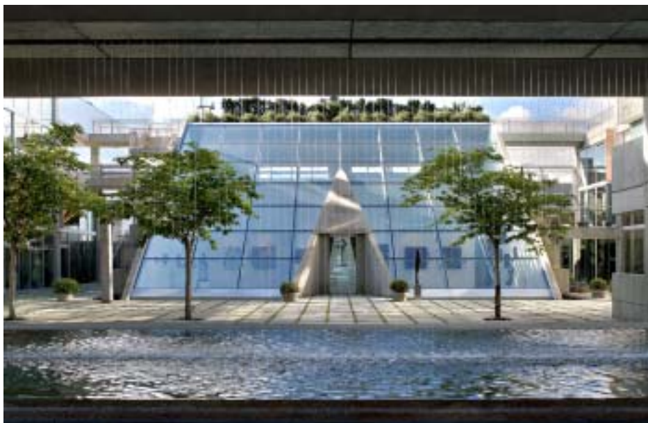
Immeuble Waterfall | Arthur Erickson avec Nick Milkovich Architects Inc.