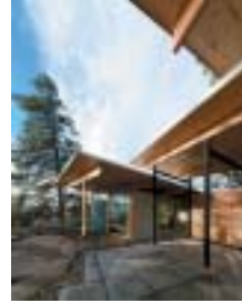
Maison Maurer

Maison Maurer Florian Maurer, MRAIC Architecte (Naramata, Colombie-Britannique)