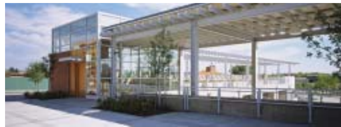
Plan directeur de Bow Valley